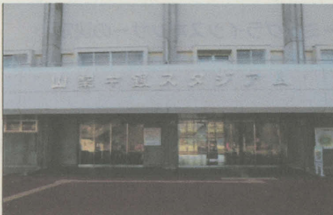
山梨中銀スタジアム (小瀬スポーツ公園陸上競技場)