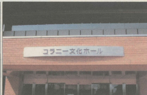
コラニー文化ホール (県民文化ホール)