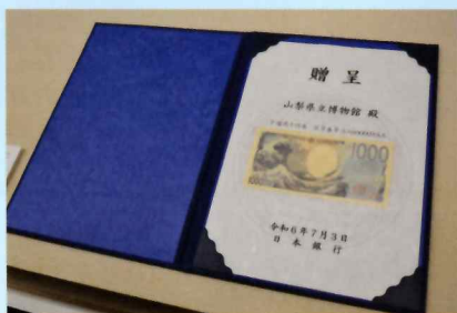
寄贈された新千円札(裏面)