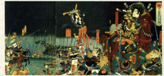
歌川国輝 天目山勝頼討死ノ図 当館所蔵

武田信玄の後継者となった武田勝頼については、近年、評価の見直しが進められ、新たな勝頼像が提示されるようになりました。本展では、武田勝頼の合戦として著名な長篠合戦や、新たな居城として築かれた新府城など、勝頼の事績や関連資料から生涯を振り返るとともに、その人物像に迫ります。