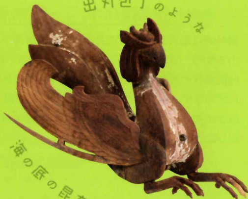
出刃包丁のような