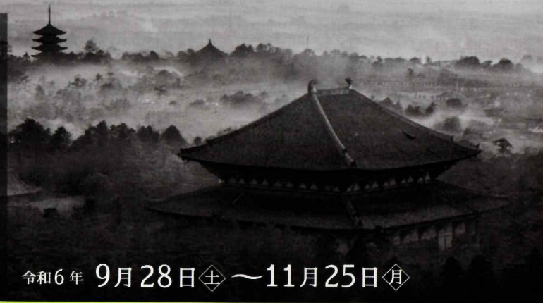
入江泰吉《古都遠望》(部分)

穏やかな自然に生まれ、悠久の歴史に彩られてきた奈良 大和路に伝わる仏像は、多くの文士たちの心を捉えてき ました。ここでは、本展で紹介する仏 像について、彼らが記した文章を掲 載します。ぜひ展示室で文士たちが 受けた感動を味わってみてください。