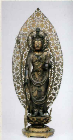
重要文化財 十一面観音菩薩立像 長谷寺所蔵

奈良大和路に伝わる仏像は、時代を越えて読み継がれる『古寺巡礼』を著した和辻哲郎をはじめ多くの文士たちの心を捉え、今も私たちを惹きつけてやみません。本展では、奈良大和路の仏像や仏画に秘められた、悠久の歴史や物語が醸し出す魅力をあますところなくご紹介します。日本を代表する仏像の数々を、この機会にご覧ください。