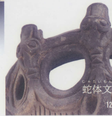
じゃたいもん 蛇体文