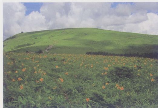
車山湿原 長野県諏訪市 ▷MAP 32

湿原は動物たちにとっても貴重な水場でした。また、縄文人たちにとっても格好の狩場として使用され、人と文化の中継地点となりました。