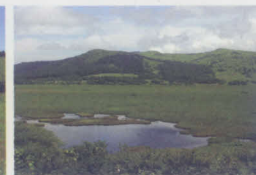
八島ヶ原湿原 長野県諏訪市・下諏訪町 ▷MAP 32