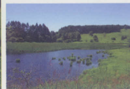
踊場湿原 長野県諏訪市 ▷MAP 32