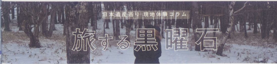
日本遺産巡り現地体験コラム