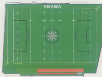
グラウンドレイアウト (イメージ)