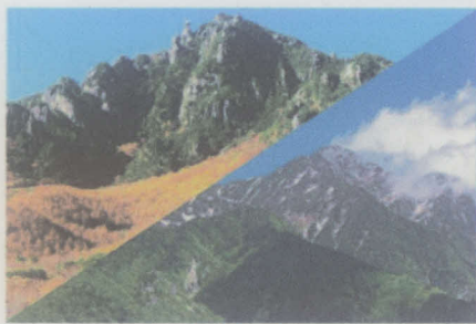
(瑞牆山・甲斐駒ヶ岳)