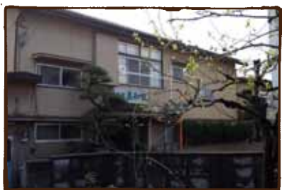
(旅館美和田) 知ってました？ 良いロケーションです。