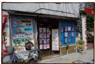
(ひなた) もう一度食べたい？ あの頃の食欲はまだあるか。