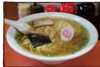
(鳳華楼) この店が懐かしい人は 不良です。