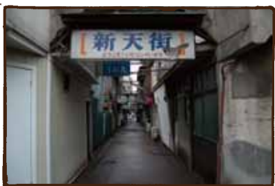
(新天街) 何軒かはまだ営業中！