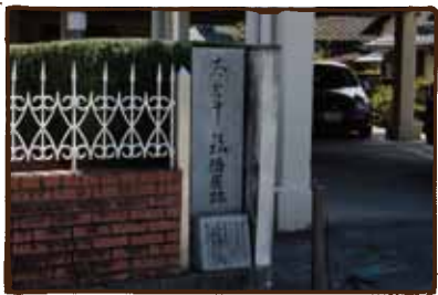
(太宰碑) 美咲町は太宰が新婚時代 住んでいた場所。