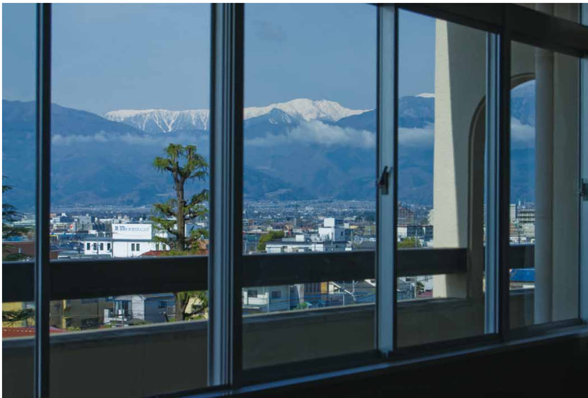
四階教室より白根三山を望む。