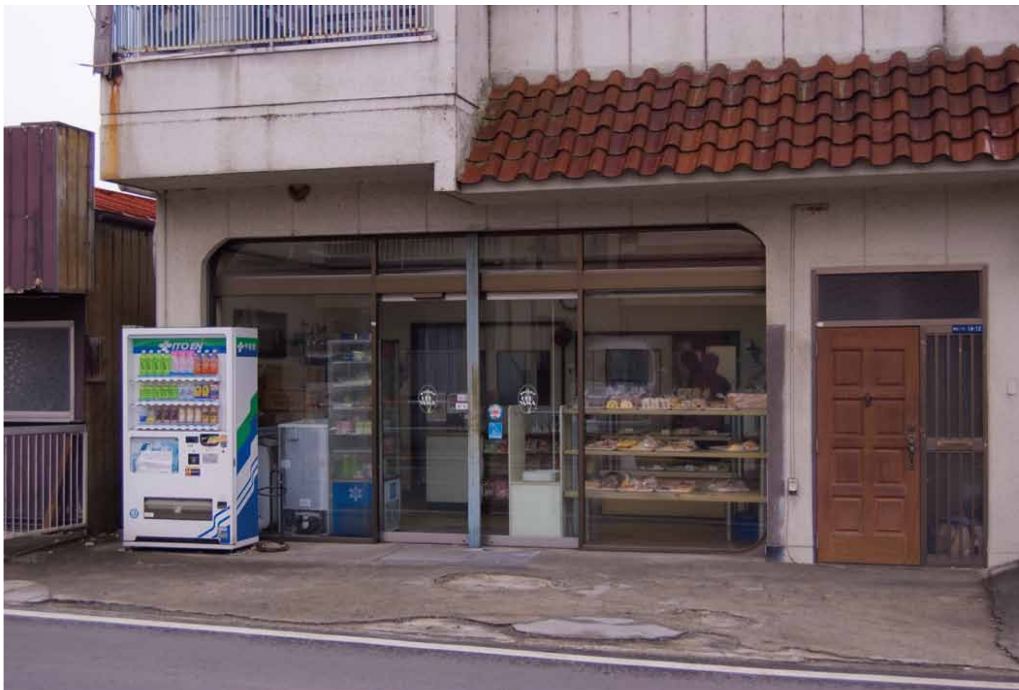
校庭裏手の奥山製パン。元気に営業中。