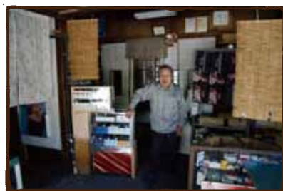
(望月商店) 店の中は当時のまま、 ご主人もご健在。