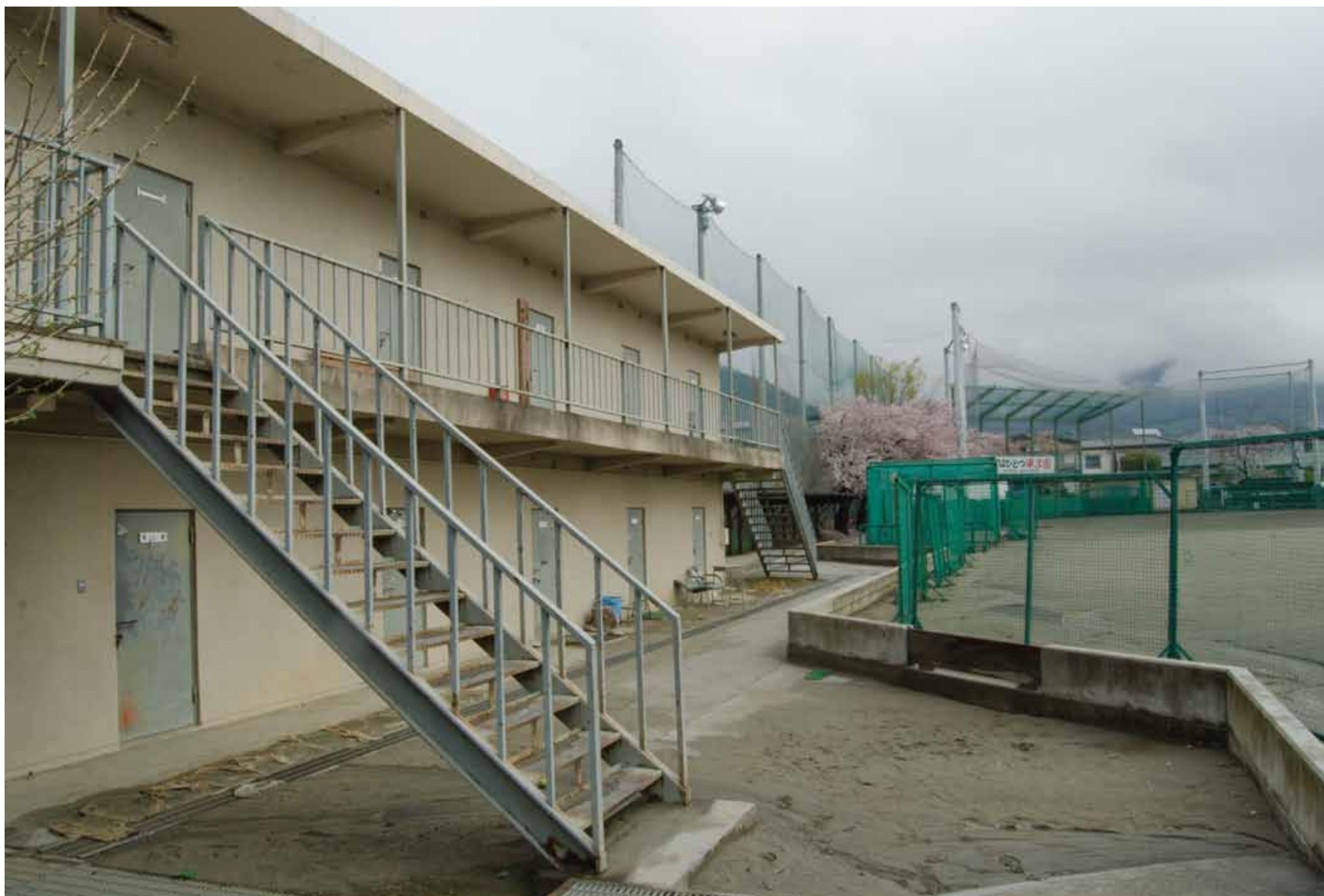
残っていた聖地、部室棟