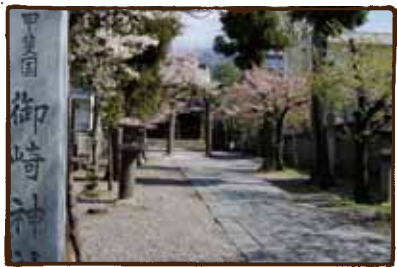
(御崎神社) オッミサキサンワ〜 ご健在です。