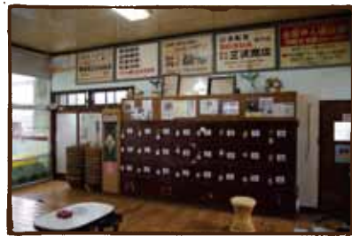
(喜久の湯) 太宰も通ったレトロな温泉。 美術部OB夫妻が経営。