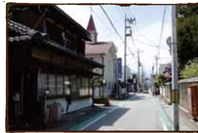
(教会) 風情あります、この通り。 天気が良いと正面に 甲斐駒が見えます。