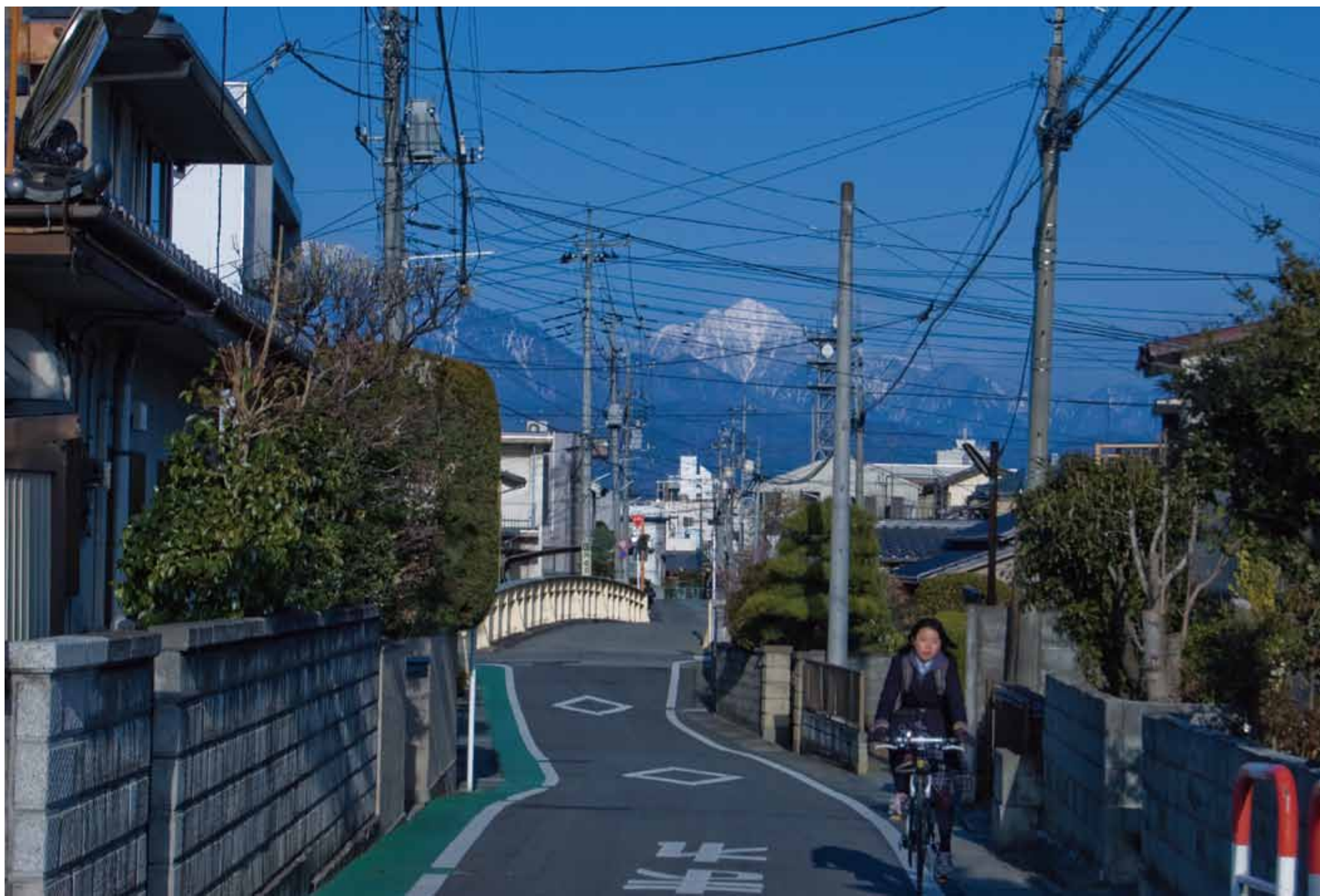
正門前の十字路より甲斐駒ヶ岳を望む。