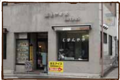
(富士アイス) 屋号だけで懐かしい。