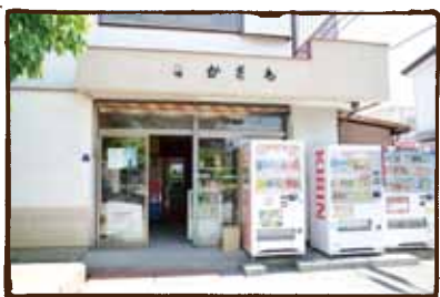
(なかざわ商店) いまだ一高生のオアシス？