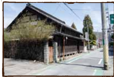
(古い家) 喜久の湯斜向かい。