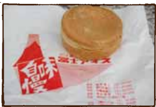
あの頃と 味も変わって ないかも。 じまんやき。