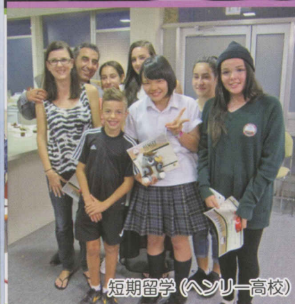
短期留学 (ヘンリー高校)