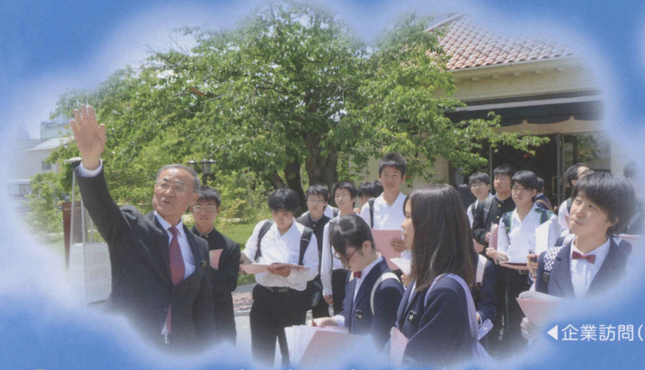
◀企業訪問(株式会社 サドヤ)