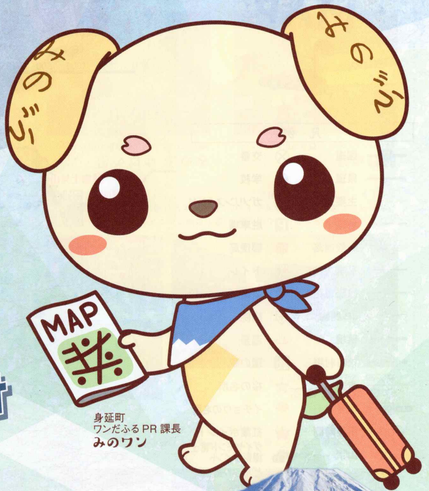
身延町 ワンだふるPR 課長 みのワン