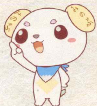
身延町公式マスコットキャラクター 「みのワン」