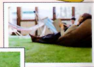
湯上がり処かえで