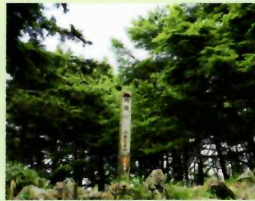
飛龍山は雲取山を凌ぐ標高を誇る

飛龍山は奥秩父山城の主脈の一つに数えられる。大洞川(荒川の支流)の源であることから別名大洞山とも呼ばれている。山頂に展望は開けていないが6月頃はシャクナゲやツツジが見頃となる。