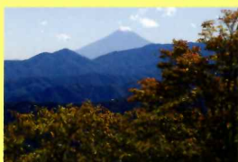
三条ダルミから望む富士山