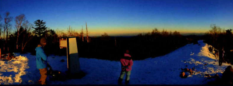
雲取山山頂360°パノラマ

雲取山山頂360°パノラマ (夕景) : QRコードからアクセスすると Panorama360° VR で、雲取山山頂の360°パノラマ画像を体感いただけます。