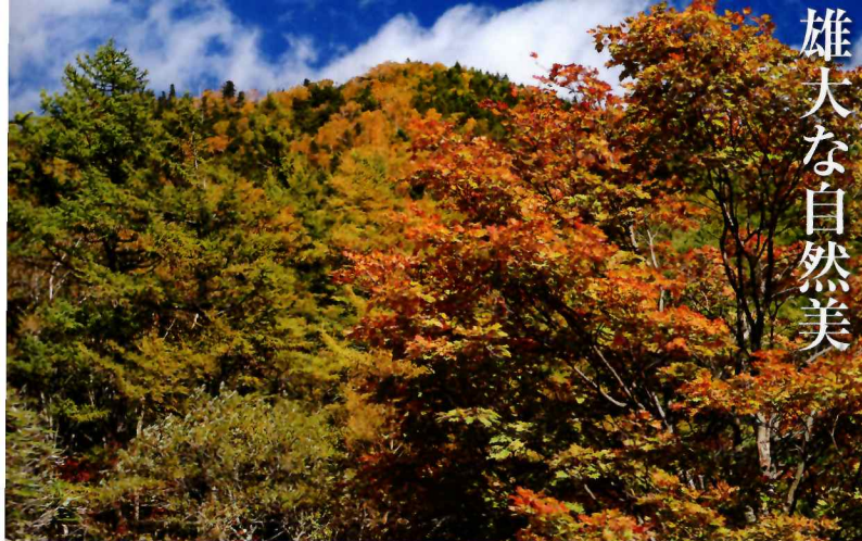
三条ダルミから見上げる雲取山山頂

Mt. Kumotoriyama COURSE 02 後山川の渓谷美を感じながら山頂を目指すコース