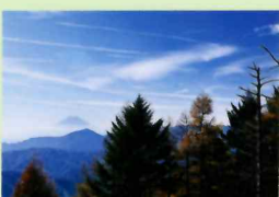
七ツ石山頂から望む富士山

鴨沢から七ツ石小屋を目指す。小屋から登山道に登ると鷹ノ巣山と七ツ石山へ至る分岐となり山頂へと至る。登山道には平将門伝説が残り、案内板が鴨沢からブナ坂まで設置される。将門の歴史ロマンを感じながら山頂を目指す！