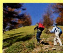
小雲取山を登れば山頂はあと

登山道は整備され登山者も多いルート。国道411号線、奥多摩湖畔の鴨沢バス停から山側の集落を上がると登山道へと至る。登山道は始め、木々の中をゆったりとした道が続く。やがて森の中を抜けると、南側に富士山を見ることもできる。その先に七ツ石方面と巻道の分岐点がある。山頂を早く目指すなら巻道を行くのがいいが、体力に余裕があれば七ツ石山もおすすめ! 唐松谷林道の分岐から尾根沿いに進む。尾根道は明るく見通しもいい。ほどなく五十人平のヘリポートと奥多摩小屋跡が見えて来る。最後の難関小雲取山の登りはきついが、ここを登り切れば山頂が見えてくる。避難小屋の赤い屋根が雲取山山頂の目印。