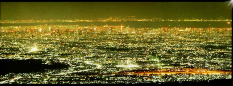
眼下に広がる東京都心の夜景

雲取山山頂360°パノラマ (夕景) : QRコードからアクセスすると Panorama360° VR で、雲取山山頂の360°パノラマ画像を体感いただけます。