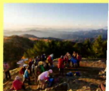
山頂は多くの登山客