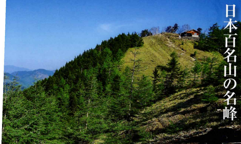
避難小屋は雲取山頂の目印