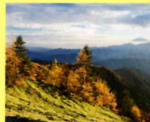
尾根道から眺める