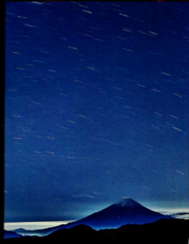
幻想的な星空と富士山