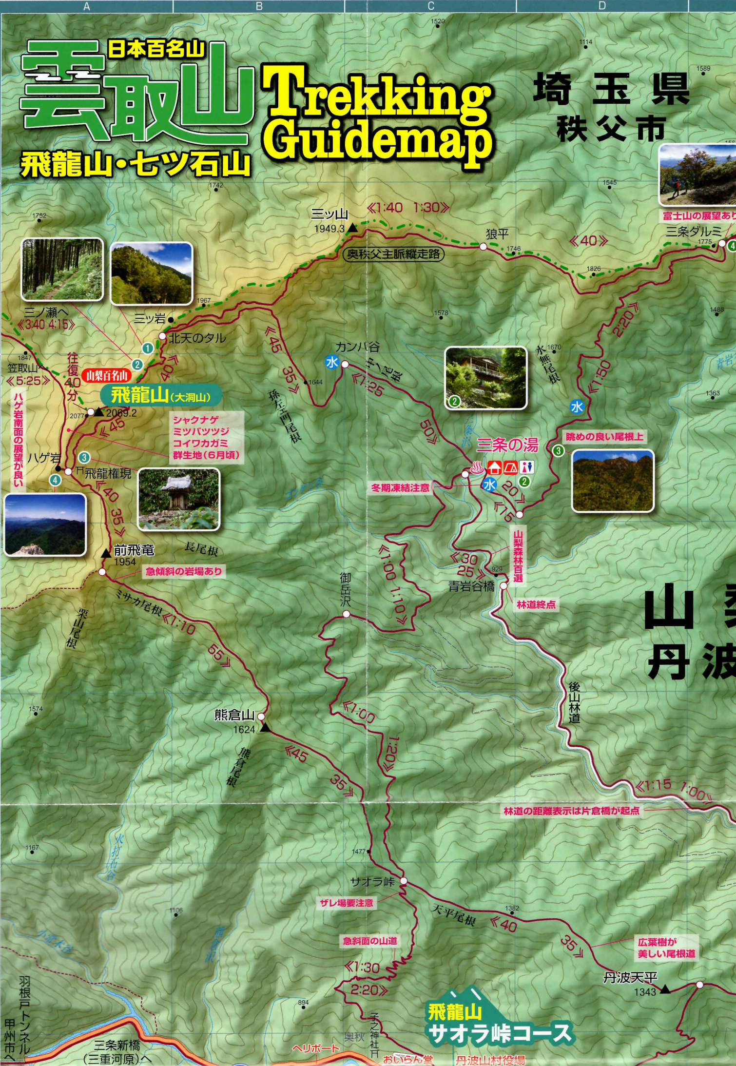
富士山の展望あり