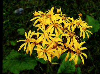
マルバダケブキ (7月下旬~8月頃)