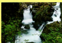
渓谷が美しい後山川

林道の終着地点から登山道を行くと三条の湯へと至る。200余年の歴史ある三条の湯の脇道を通り三条沢を渡ると本格的な登山道に入る。登山道は木々の中を行くため、展望が開けている箇所は少ないが、水無尾根の一部から奥秩父主脈縦走路の山々を眺められる場所もある。三条ダルミ付近は視界が良好となり富士山の眺望も良い。三条ダルミは飛龍山方面への分岐でもあり、雲取山へは東の尾根を登る。三条ダルミからの登りは約40分、山頂まではもう少し！