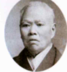
山梨中銀金融資料館所蔵

武士を志し江戸に出たが挫折し、葉煙草を中心に行商生活を営む。横浜開港時に 生糸・水晶などを売り巨利を得たことから、蚕糸業に力を入れ甲州糸の評価を高 めた。明治10（1877）年、第十国立銀行（現山梨中央銀行）設立の最高出資者 となる。明治22（1889）年に初代甲府市長、翌年には県内初の貴族院議員に当 選。「株式は“あかり”と“乗りもの”に限る」と、当時の成長産業への投資を おこなった。山梨県出身の実業家たちが東京電燈株式会社（現東京電力）を勢力 下に置いた頃から、財界で「甲州財閥」として認知され始め、その巨頭と仰がれ た。明治32（1899）年、行商時代からの宿願だった開国橋の架橋を果たした。