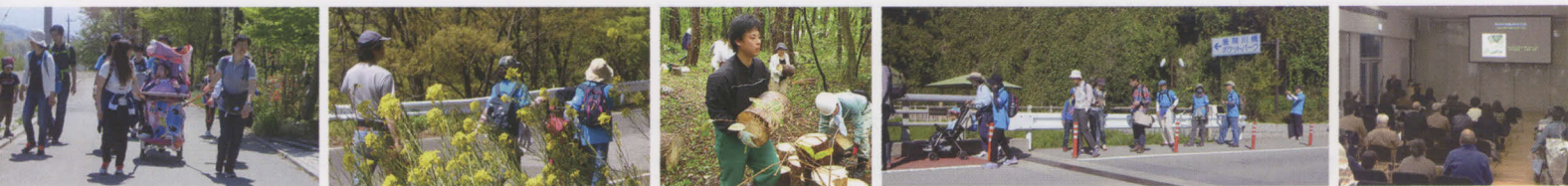
「新緑ウォーク」には約200名が参加し、楽しいイベントとなりました。難病のこども支援全国ネットワーク主催の草刈りや、秋のチャリティウォーキング、講演会をサポートしました。

裏面の入会申込書にご記入の上、FAXまたは郵送にてご送付お願いします。ホームページをご覧ください、メールでもお申込みいただけます。甲府一高あおぞら会のホームページ http://www.ymkp.net/aozora/ 事務局メールアドレス aozora@ymkp.net