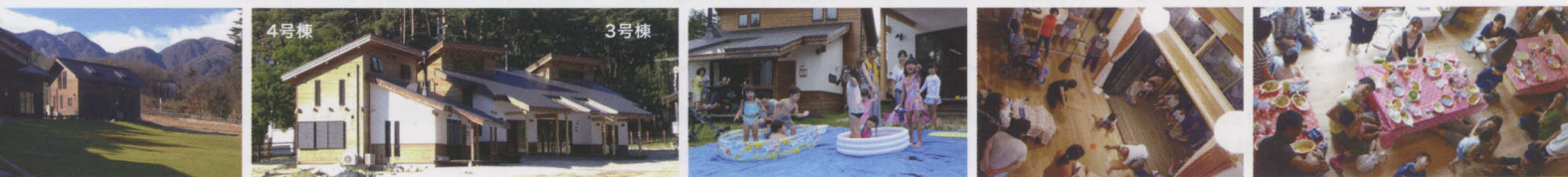
順調に建設は進み、芝生も青々と成長しました。20人が泊まれる3号棟が完成し、団体での利用も可能になりました。室内でイベント(ゲームなど)や会議や大人数での食事もできます。