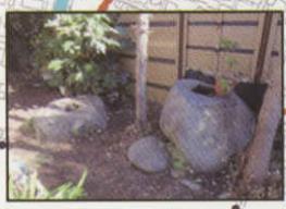
玄法院の時の鐘の礎石

歩兵第四十九連隊（甲府連隊）が食料庫として使っていた建物を補修し、教育資料の展示を行っています。建物は明治期洋風建物として、県内現存最大規模の煉瓦建造物です。