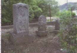
梅木堀栓元に祀られる文化元年(1804)銘のある馬頭観音