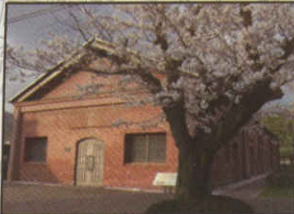
山梨大学赤レンガ館

歩兵第四十九連隊（甲府連隊）が食料庫として使っていた建物を補修し、教育資料の展示を行っています。建物は明治期洋風建物として、県内現存最大規模の煉瓦建造物です。