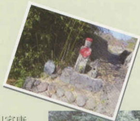
梅翁曲輪の水神様

平成元年の発掘調査で、馬出土塁の下から馬の骨が1体分発見されました。これは全国的にも珍しい事例です。頭を北側に、顔を西方に向けて筵に覆われていました。また詳細に骨を調べた結果、良質な餌を与えられ、大事にされていた事が分かりました。もしかしたら、曲輪を作る際の生贄として埋められたのかもしれませんが。