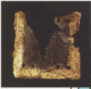
出土した馬鎧の断片