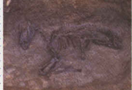
西曲輪南虎口から発見された馬骨

武田騎馬隊は無かった!? 武田の軍隊といえば、毎年4月に行われる信玄公祭りの騎馬行列のように、騎馬隊を思い浮かべる人も多いのではないでしょうか。でも実は、武田軍に騎馬隊は無かったという研究があります。色々な資料を調べても、むしろ騎馬の数は他の戦国大名家より少なかったそうです。ではどうしてそんなイメージが?それは長篠の合戦に触れた織田方の文献に多く登場したからだと思います。信長の武功を強調する為とも言われますが、死を覚悟して騎馬で敵陣に向かっていった武田軍の勇猛さが、強烈に印象づけられた所為かもしれません。