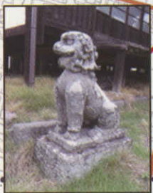
天明7年銘の満蔵院の狛犬。市内で確認されている中では最も古い石製狛犬の一つ。