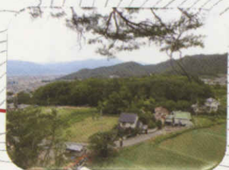
躑躅ヶ崎亭跡より武田館を望む。