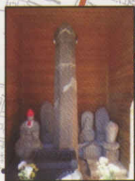
浄興寺にある県内最大の六角石幢。