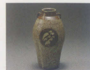
島岡達三(地釉象嵌縄文水差)