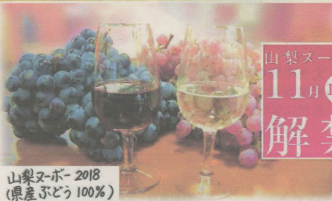
山梨ヌーボ-2018 (県産ぶどう 100%)

冬のギフトにもおすすめの 特産品です。 ふるさと納税のあたたかさをお届けします。