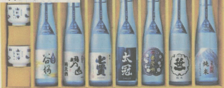
山梨の酒 (県産の米・水 100%)