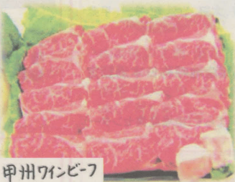
甲州ワインビーフ