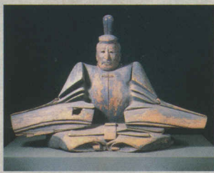
最古の源頼朝・実朝木像(県・市指定文化財)