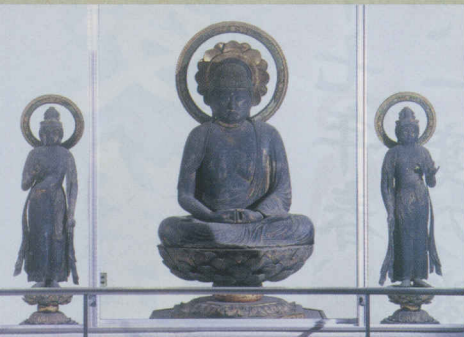
阿弥陀三尊像(重要文化財)